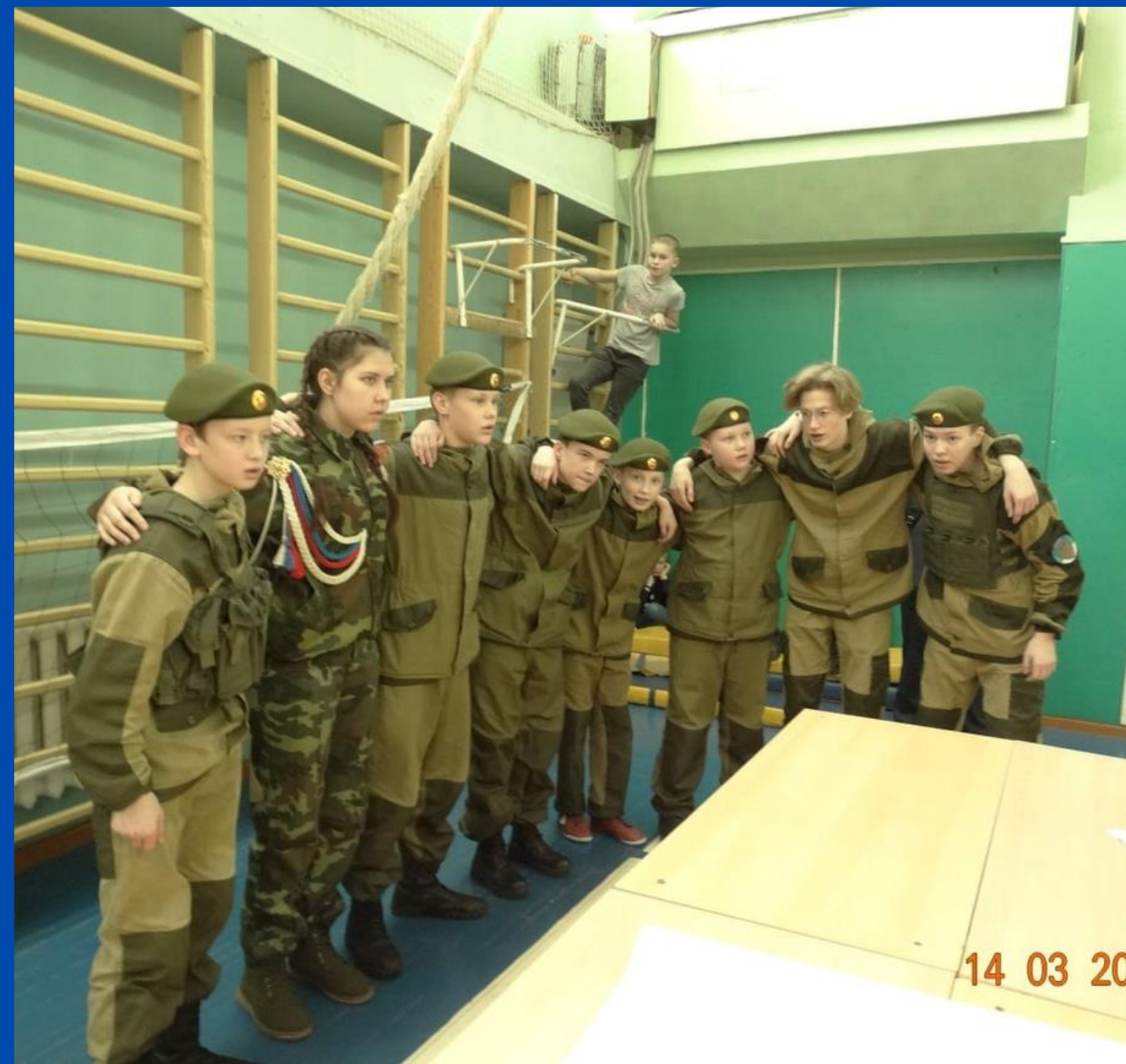
"Патриотический десант" РДШ Сторожевск