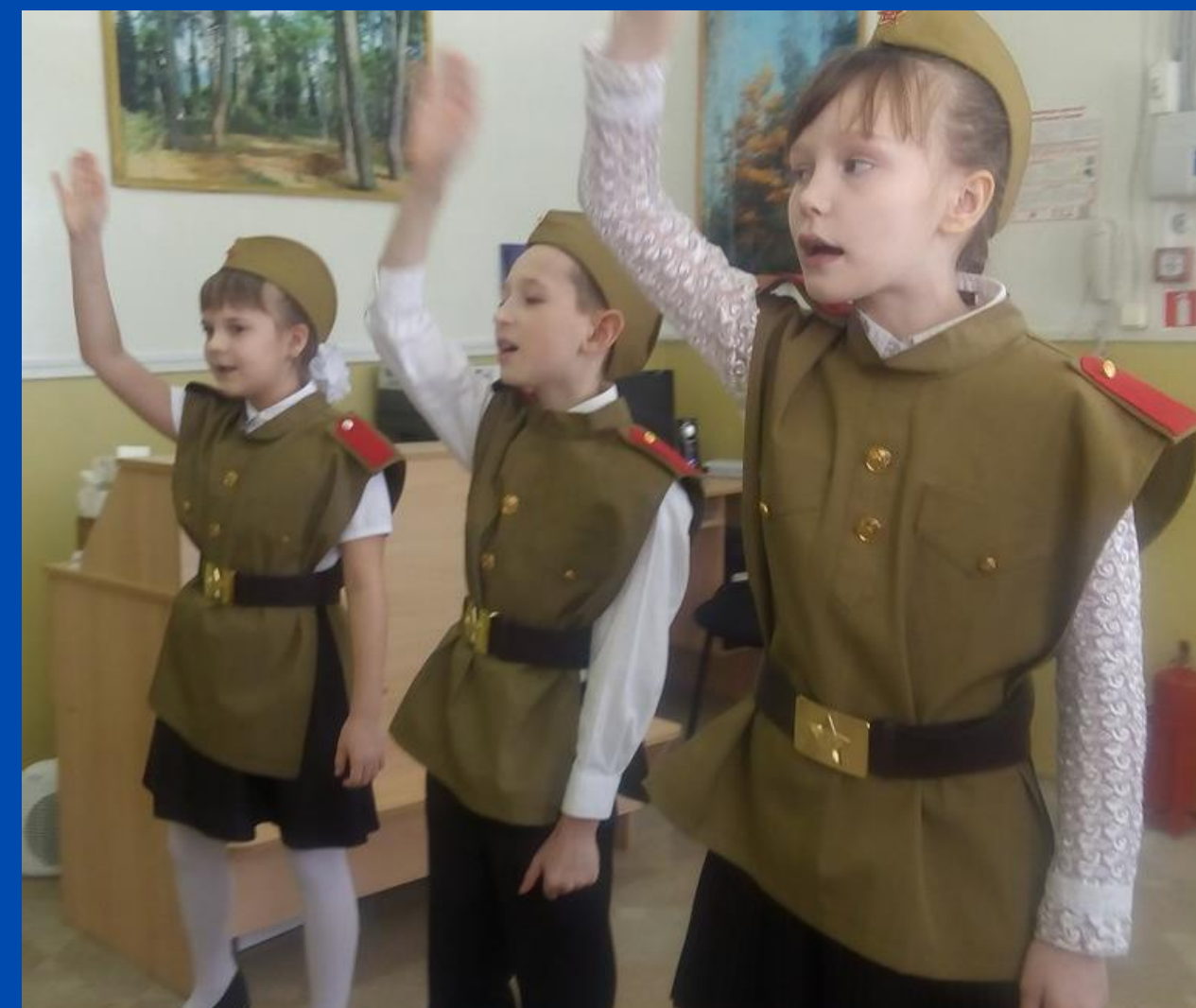
Активисты РДШ пст.Первомайский