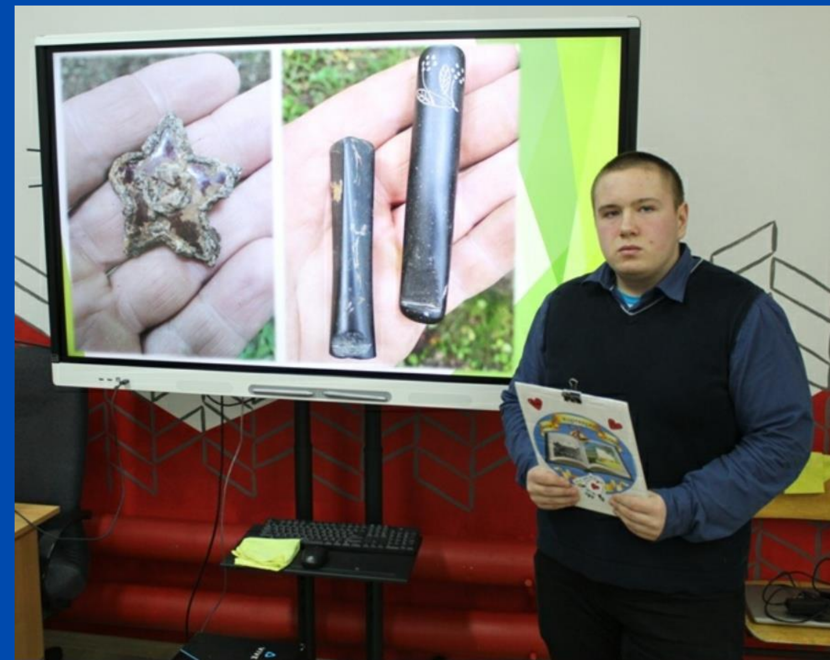
"Уроки памяти" РДШ Корткерос