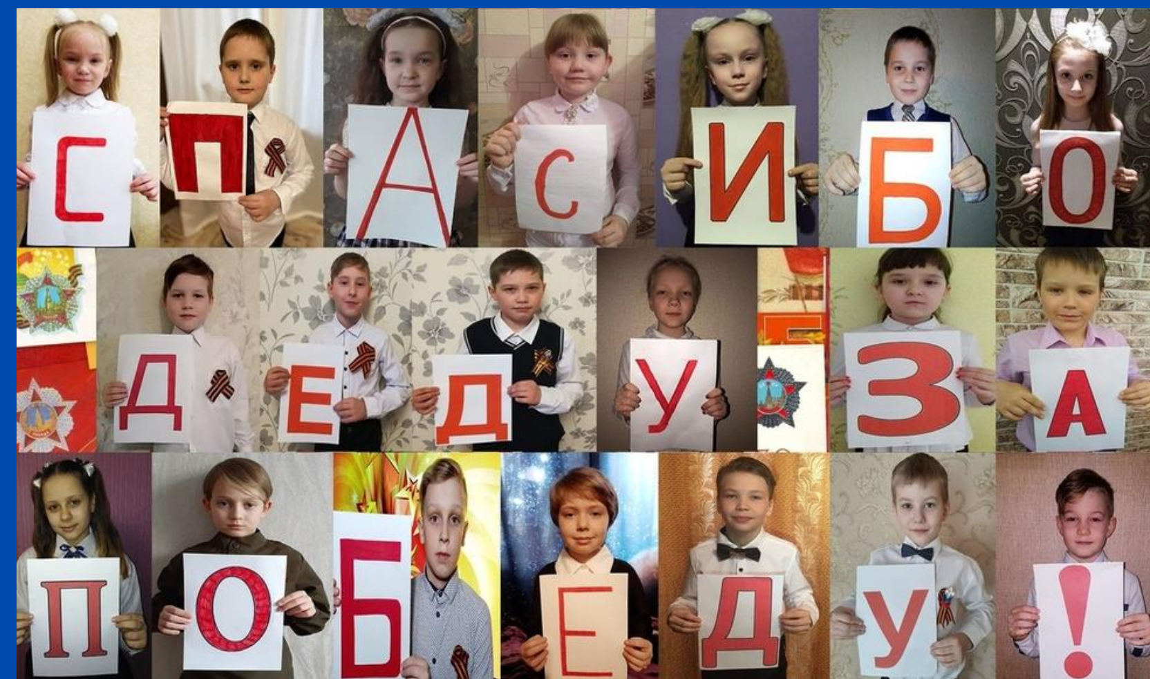
Акция "Помню и Горжусь" РДШ Нижний Одес