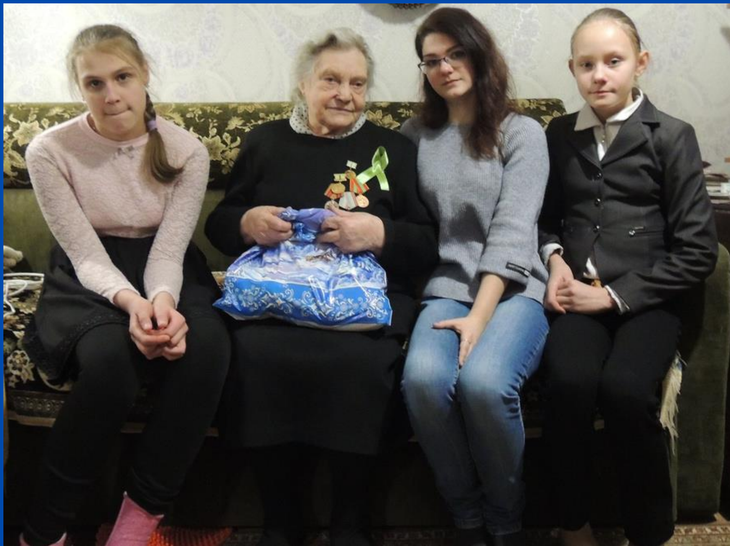
Активисты РДШ Инты в гостях у жительницы блокадного Ленинграда