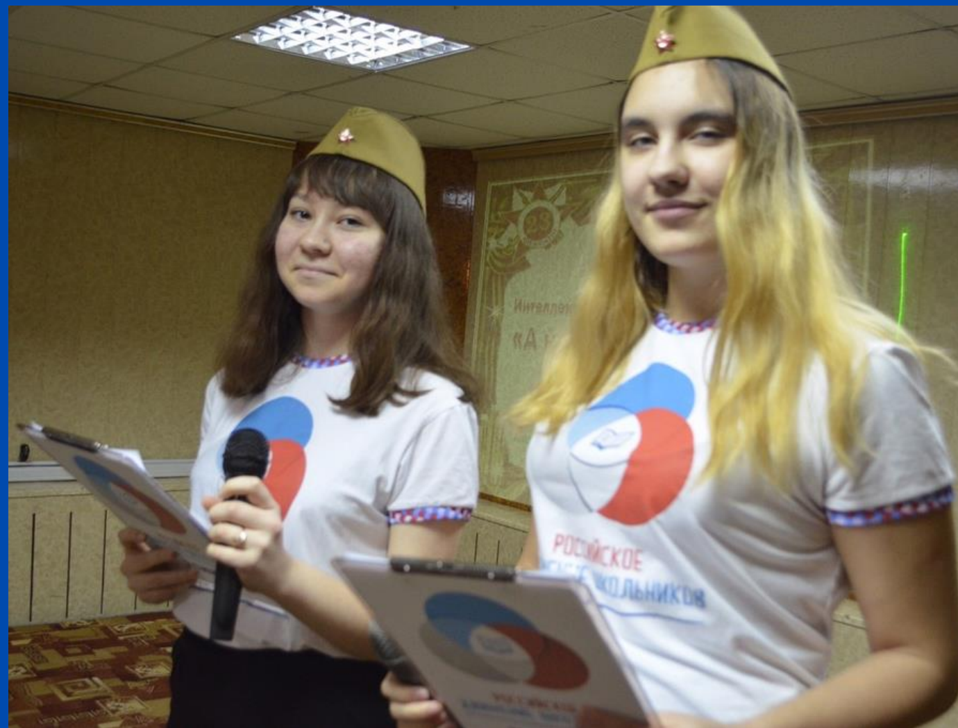
Спортивная игра от активистов РДШ Усинск