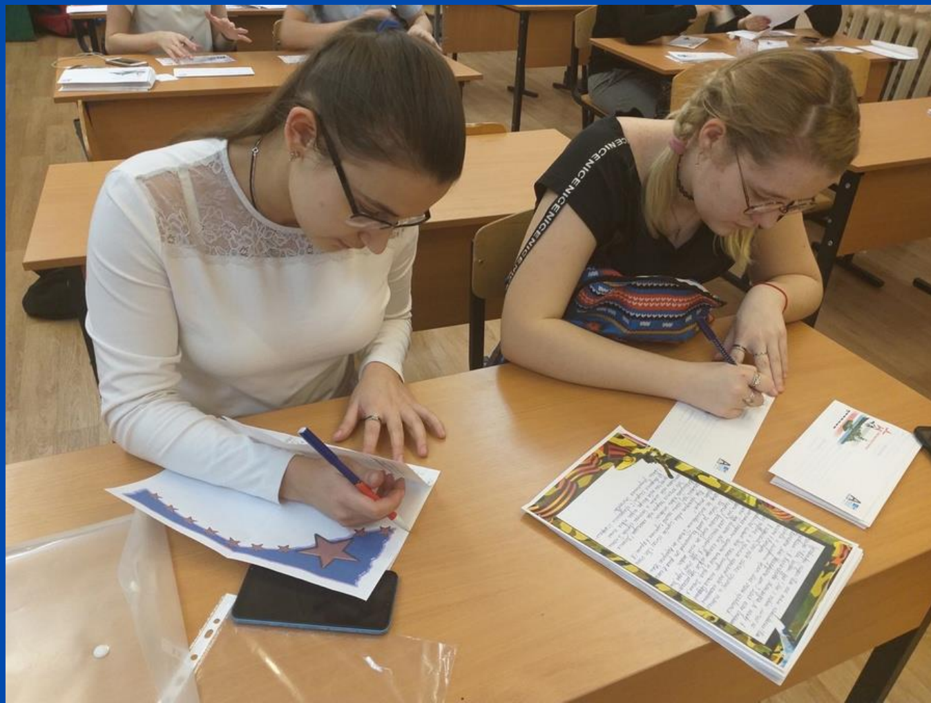
Акция "Письмо солдату"