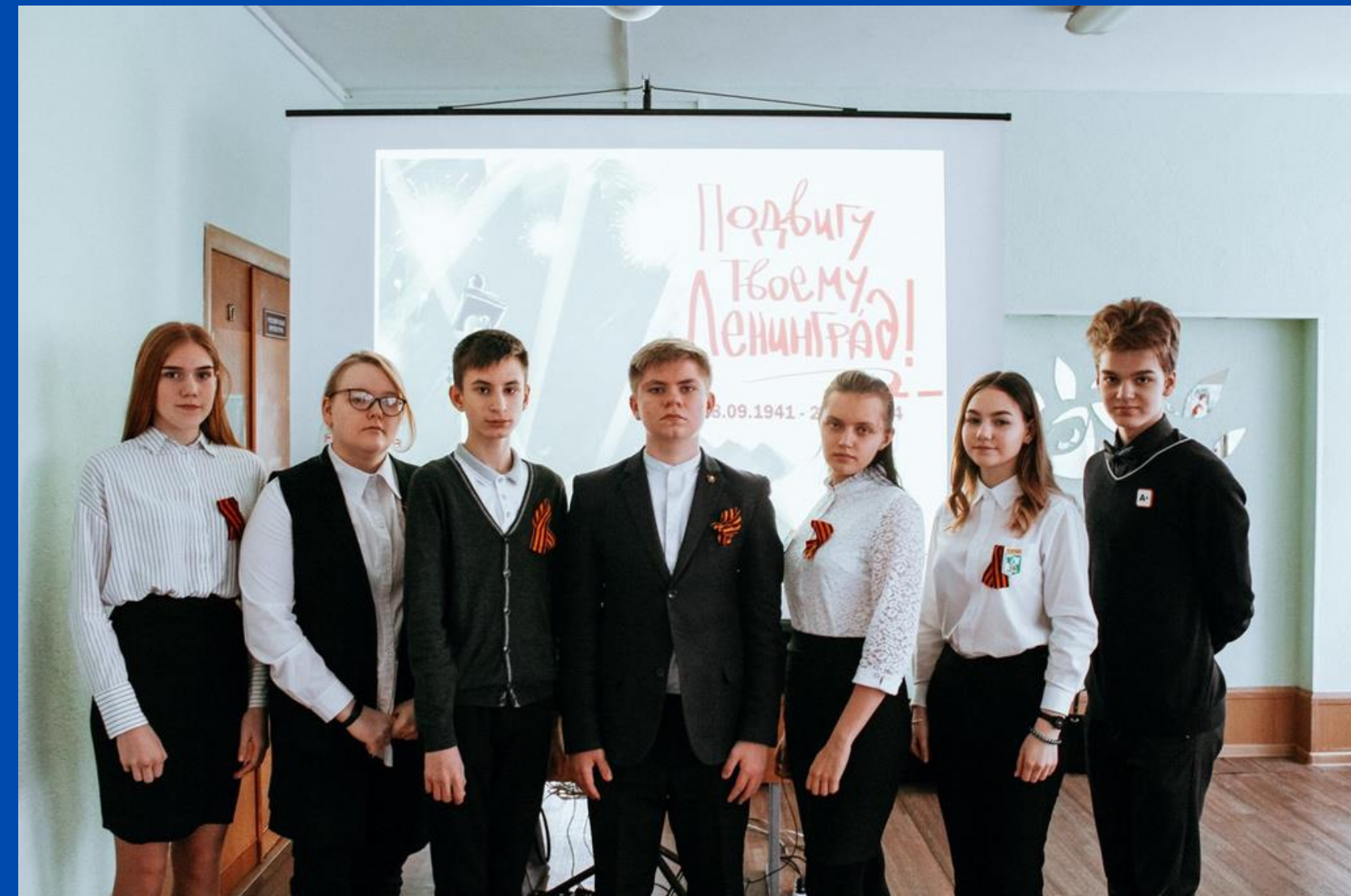
МОУ "СОШ №35 с УИОП" г.Воркуты