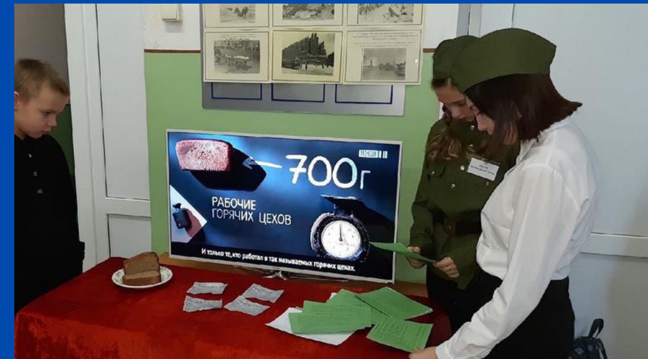
Активисты РДШ Сосногорска