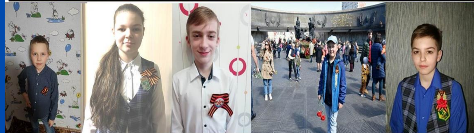
Акция "Георгиевская ленточка онлайн" РДШ Воркута