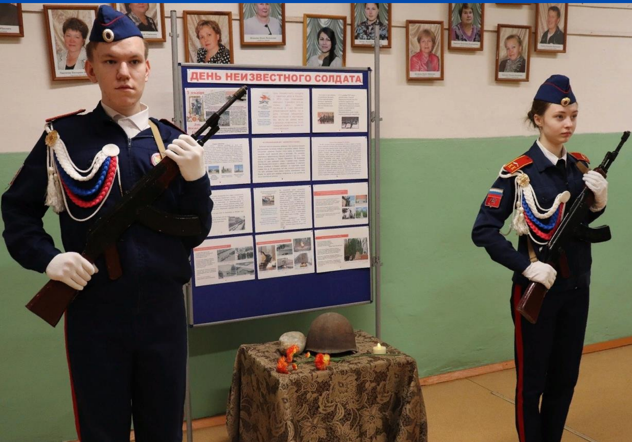
"Уроки Памяти" РДШ Объячево