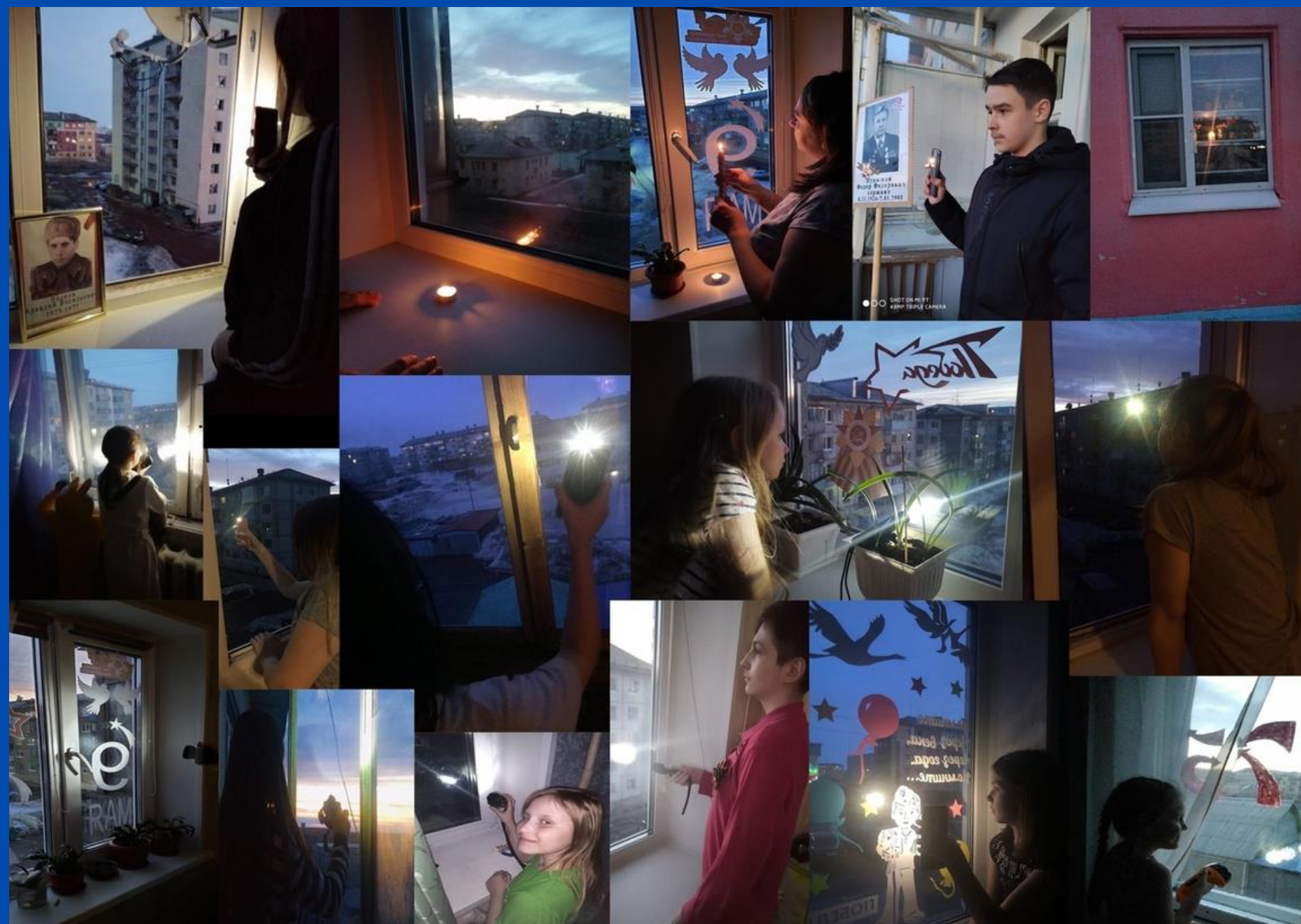
Акция "Фонарики Победы" РДШ Воркута