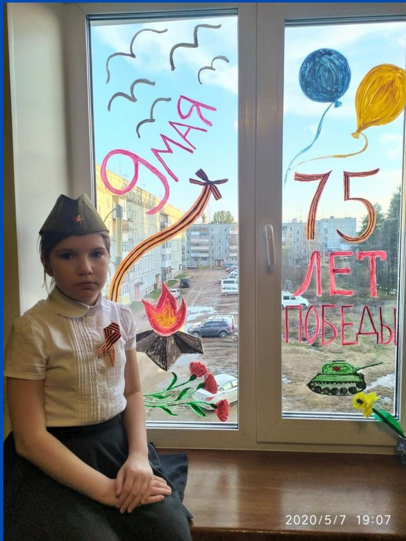
Акция "Окна Победы"