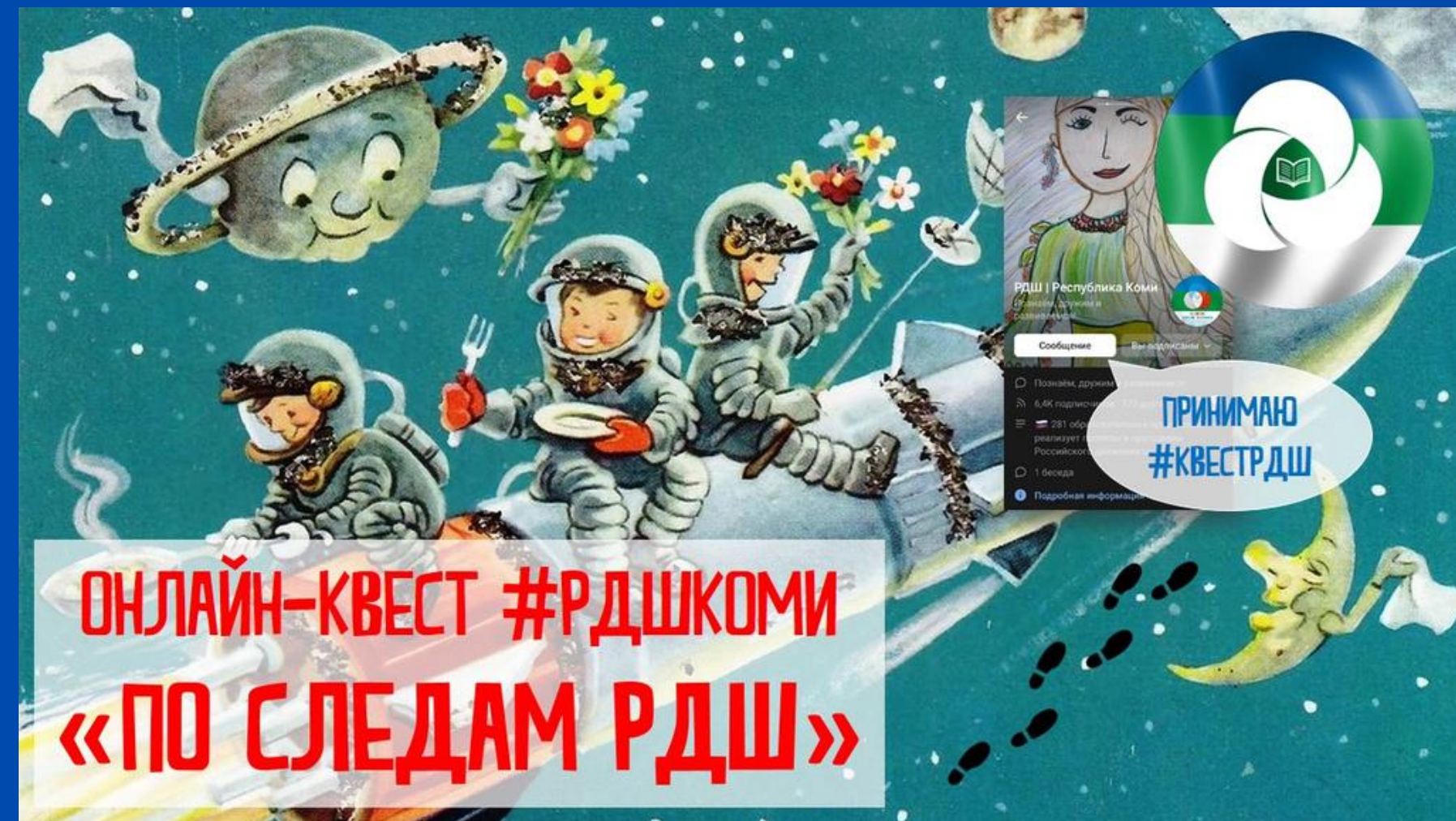
Онлайн-квест от РДШ Республики Коми