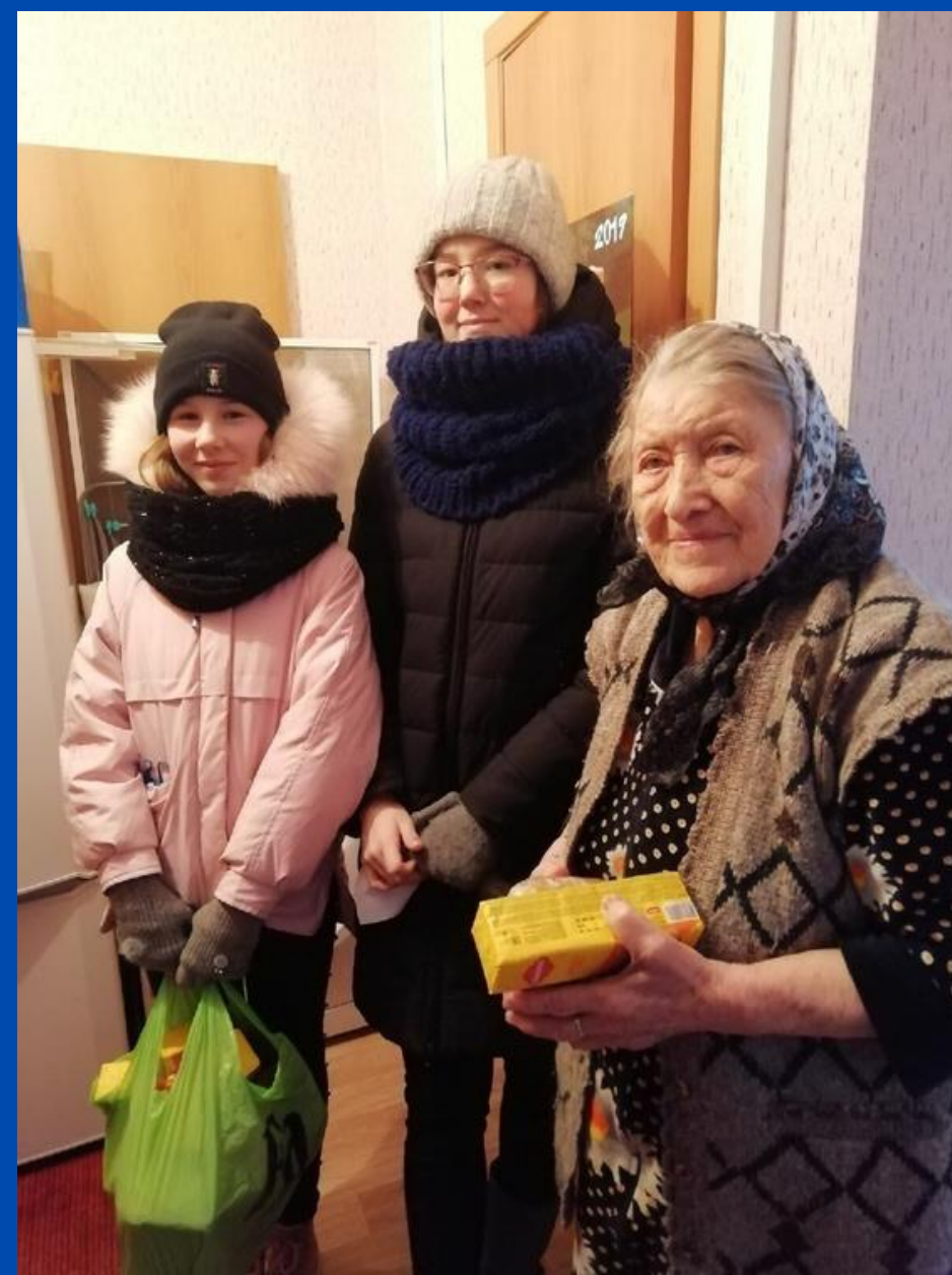
Акция "Блокадный хлеб" Активисты РДШ Усть-Уса