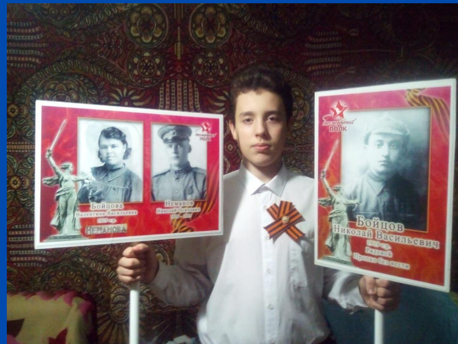
Акция "Помню и Горжусь" РДШ Инта