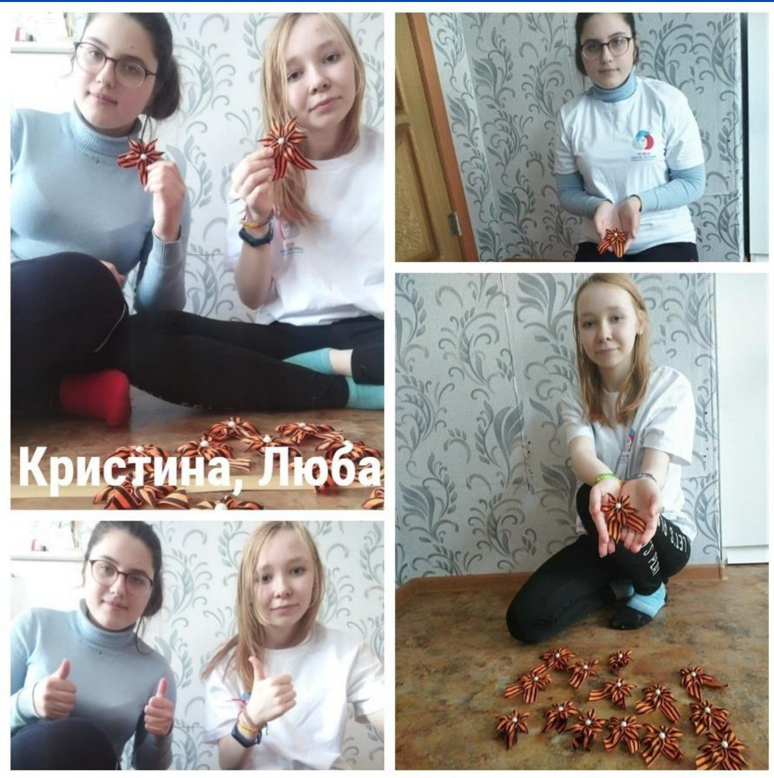
Акция "Георгиевская ленточка" РДШ Усть-Вымь