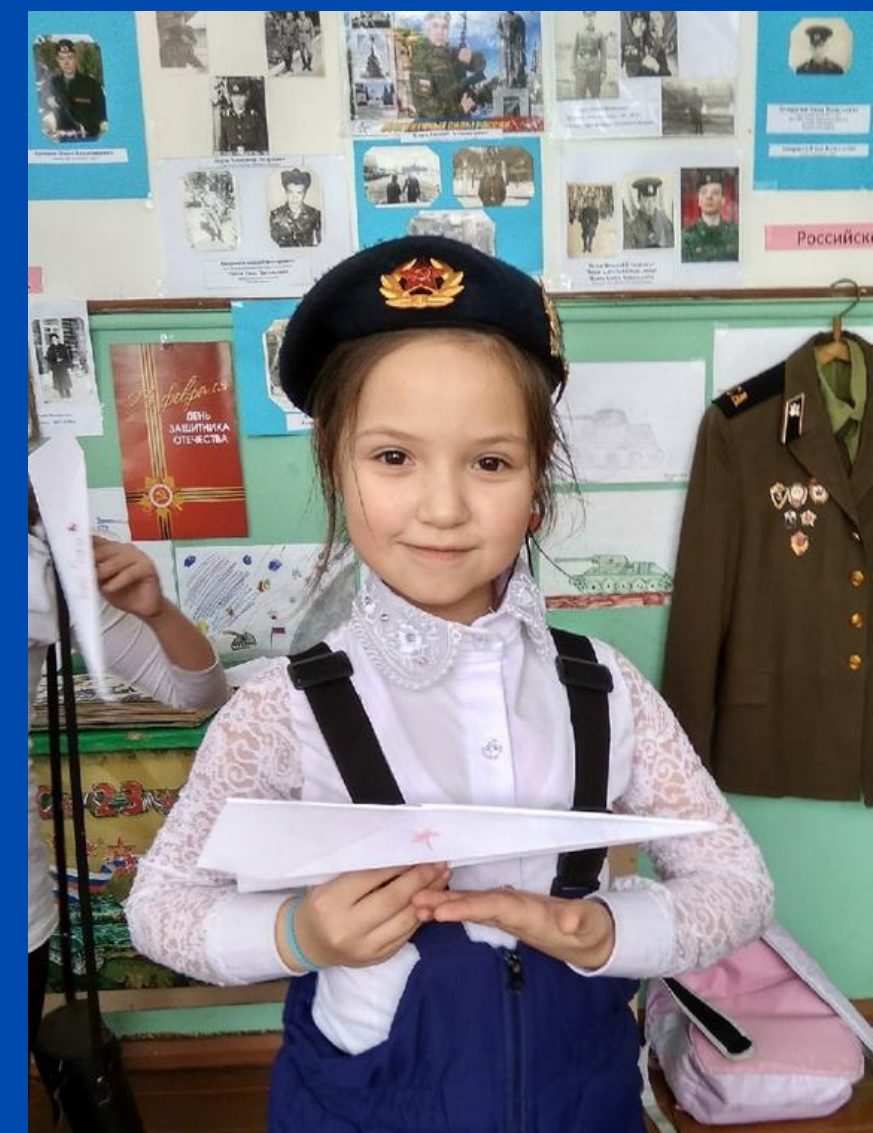
Акция "Авиатор" Подтыбок