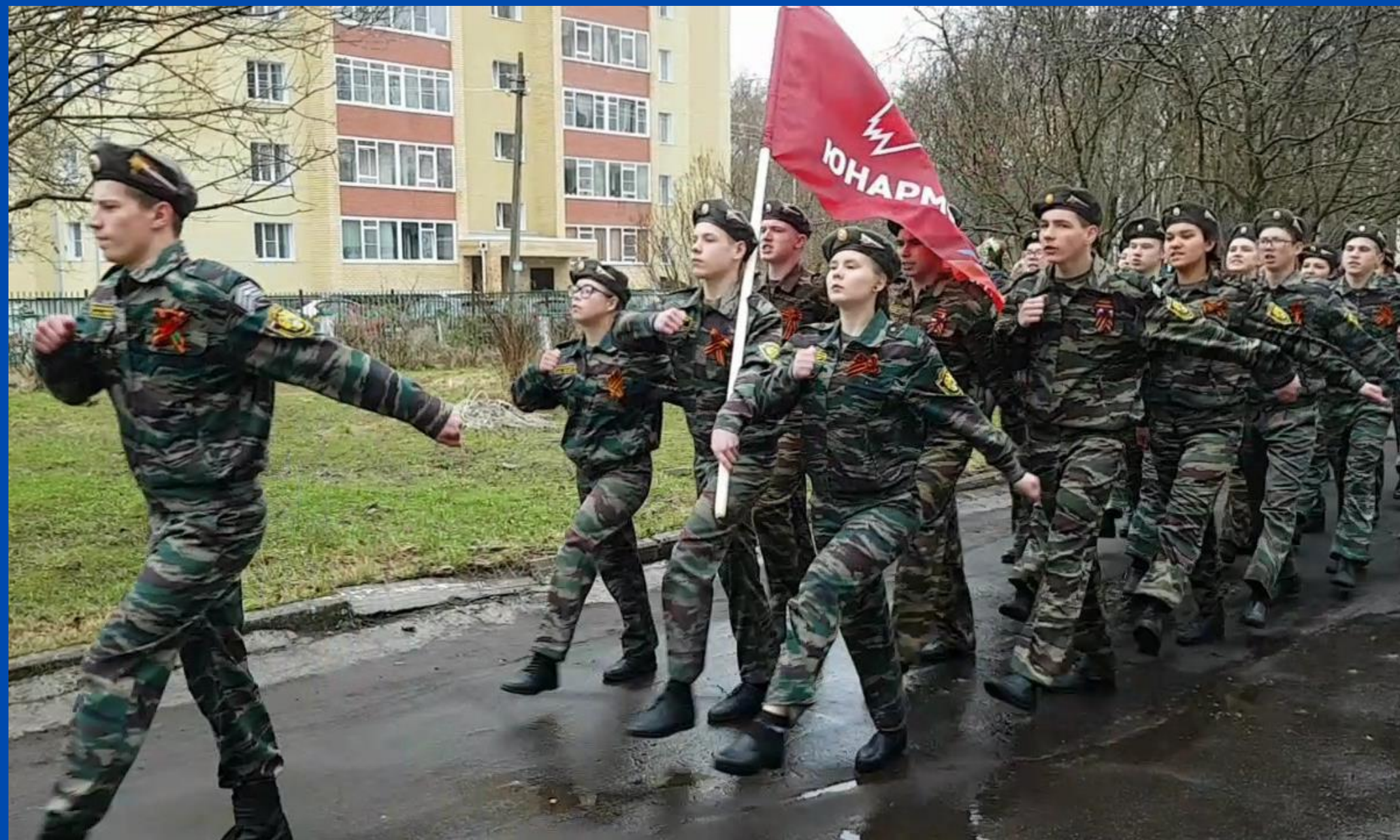
День Победы РДШ Сыктывкар